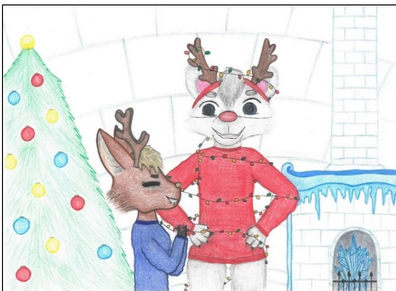
Csapó Amira 6.b, immár 7.b